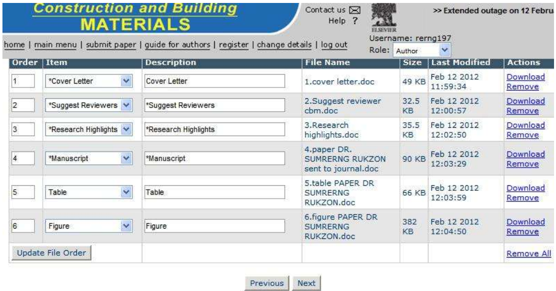
รูปที่ 21 ไฟล์ที่ส่งทั้งหมด