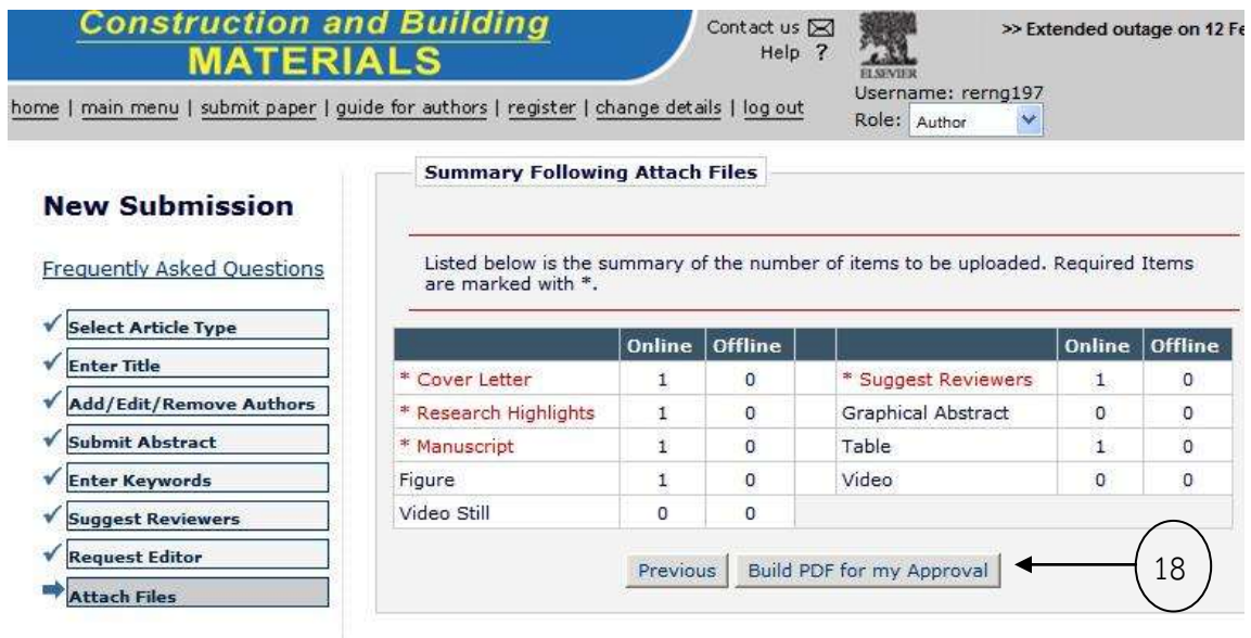
รูปที่ 22 เปลี่ยนเป็น pdf

8) ในรูปที่ 22 ให้เลือกคลิก “Build PDF for my Approval” ในหมายเลข 18 รูปที่ 22 ขั้นตอนนี้ระบบจะทำไฟล์ข้อมูล (ปกติเป็น word) ให้กลายเป็น PDF โดยอัตโนมัติ จะได้เป็นรูปที่ 23 และเลือกคลิกหมายเลข 19 จะได้รูปที่ 24